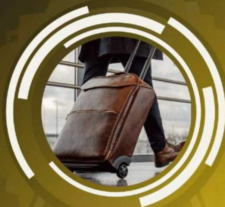
Leather Travelling Bag